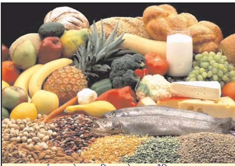
गर्भावस्था के समय लिए जाने वाला पौष्टिक आहार

का। इस उपहार के द्वारा ईश्वर ने हमें अपना आशीर्वाद दिया है। इंसान का जन्म माँ की कोख से होता है। महिला अपने पेट में बच्चे को नौ महीने तक पालती है। जन्म के बाद इंसान को जिन-जिन अंगों की जरूरत होती है वे माँ की कोख में विकास करते समय ही तैयार होते हैं। जैसे देखने के लिए आंखें, सुनने के लिए कान, बोलने के लिए मुँह, स्वाद लेने के लिए जीभ,